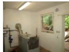
OBR.: obchvat lomu, Masty hasičárna, Hroška kotelna

Cesta z Polomu na Škutinu okolo lomové stěny je již minulostí. Podnik M-Silnice, provozující Lom Masty z důvodu rozšíření těžby kamene na dalších 20 – 30 let přeložil stávající obslužnou komunikaci z Polomu na Škutinu jiným směrem. Nová cesta sloužící hlavně obyvatelům č.p. 28 a 30 dále poštovním doručovatelům a cyklistům je doplněna uměle navrženým protihlukovým valem, který bude osázen stromovím.