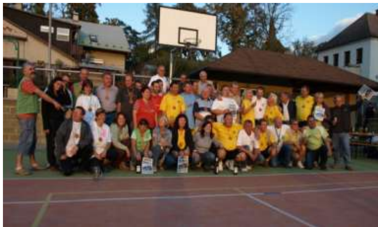
OBR.: setkání starostů- Mikroregion Bělá a Hornolidečsko

Víceúčelové hřiště v Bílém Újezdě v pátek 25.9.2009 hostilo zástupce Mikroregionů Bělá a Hornolidečska . V rámci sportovního odpoledne aneb „DSO slaví 10 let výročí od založení“ byla slavnostně pokřtěna publikace „Úspěšně realizované projekty na území DSO Mikroregion Bělá“. Setkání se zúčastnili starostové, místostarostové a zastupitelé 20 obcí Mikroregionů Bělá a Hornolidečska, kteří složili osm soutěžních mužstev, zápolících v 10 netradičních disciplínách. Po 1,5 hodinovém zápole o body se nejlépe s úskalím soutěže vyrovnaly týmy Hornolidečska, které obsadily první tři místa. Patrně pravá moravská slivovice byla tím nejlepším dopingem k úspěchu. Na závěr dne se všichni hosté přemístili do Hrošky, kde v areálu koupaliště povečeřeli a při hudbě zhodnotili celé setkání.