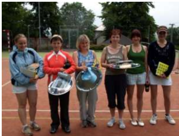
OBR.: vyhlášení vítězů