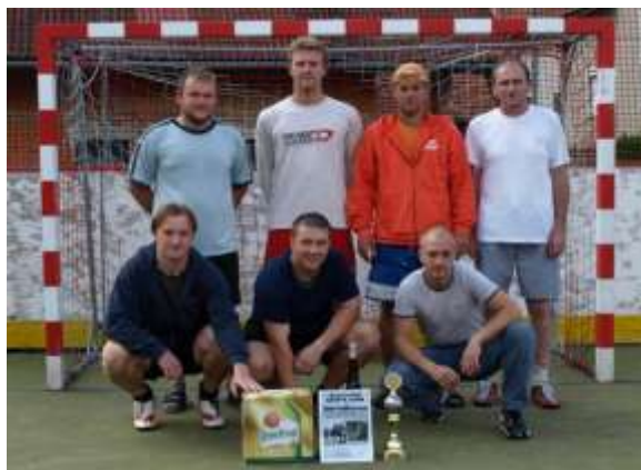
OBR.: Újezdecký balet na 2. místě

Pořadatelé děkují za účast všem mužstvům, za jejich sportovní výkony a korektní chování i v extrémních podmínkách. Divákům pak za přízeň, aktivní a slušné fandění.