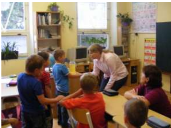
OBR.: projekt „Kvalitně i na vesnici“

Základní myšlenkou tohoto projektu bylo spojení tří malých škol (ZŠ Bílý Újezd, ZŠ Dobré, ZŠ Podbřeží) a umožnit tak rovný přístup k žákům.